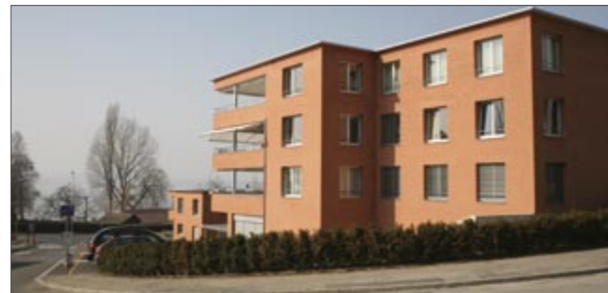
Tellenmatt: Das alte Wohnhaus steht seit Jahrzehnten nicht mehr – an seiner Stelle wurde vor kurzem eine Arealüberbauung realisiert