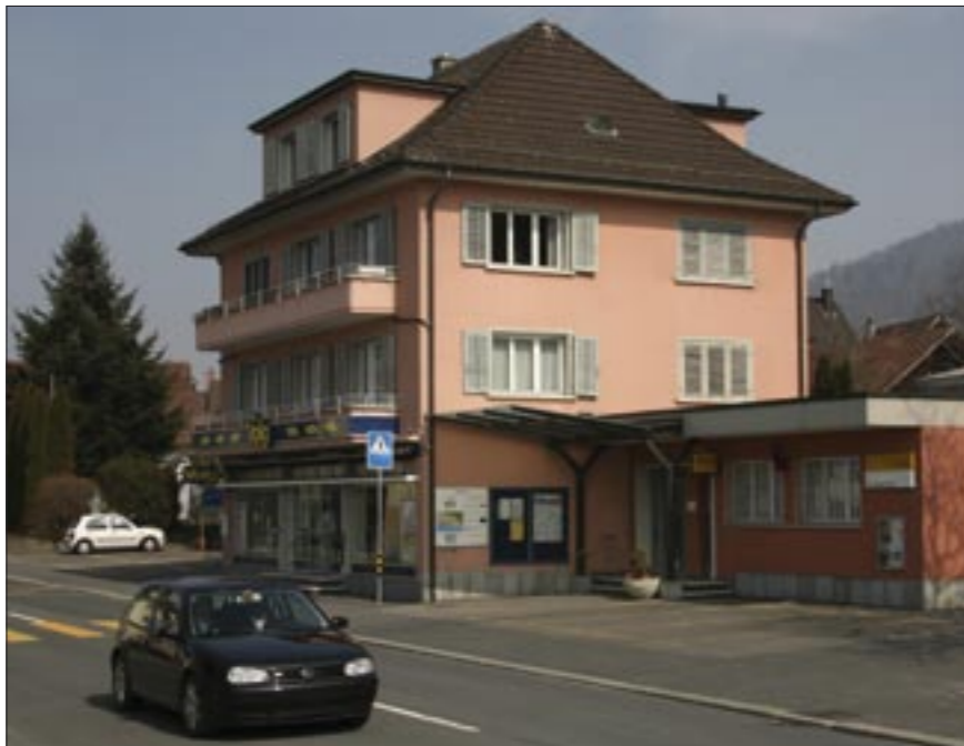
Links: Der alte Konsum wurde abgerissen – an seiner Stelle steht der heutige Dorfladen und die Post Oberwil