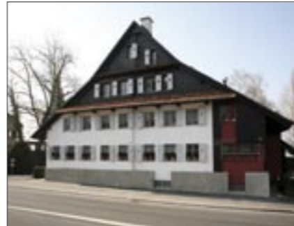
Oben: Die «Alte Post» gestern und heute: Artherstrasse 102