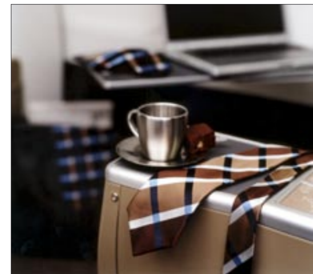
Krawatte 100% Seide, gewoben – fotografiert im Airbus A340-300 der Swiss, dessen Farb- und Textilgestaltung im Interieur ebenfalls von Caroline Flüeler stammt.

«Ich komme viel herum, doch zu Hause und verwurzelt bin ich in Oberwil» sagt Caroline Flüeler bestimmt. Hier nehme sie ihre Inspiration her; das Farbenspiel bei Sonnenuntergängen und die Ruhe geben ihr die Möglichkeit und Energie, die vielen Eindrücke auf das Wesentliche zu reduzieren. «Man grüsst sich auf der Strasse. Das ist ein Stück der Wurzel und es zeigt: man ist daheim.»