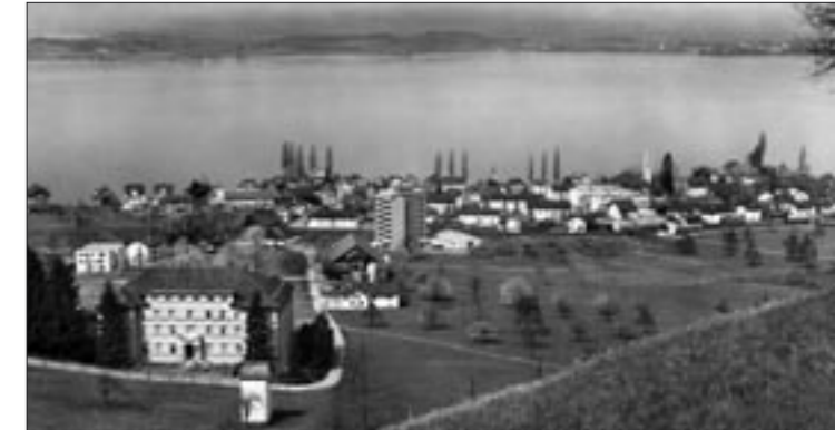
Perspektiven, die manche Veränderung der letzten Jahre aufzeigen – insbesondere bei der Klinik und im Dorf das Alterszentrum Mülimatt