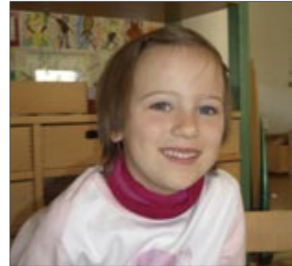
Glynis malte eine bevölkerte Turnhalle