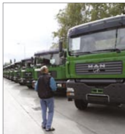
Familienbetrieb seit Anbeginn – heute schon in der dritten Generation.

Zwar hat die Firmengruppe ihren Sitz im Jahr 2000 von Oberwil nach Baar verlegt, aber die in der dritten Generation geführte Familienunternehmung ist durch die in Oberwil wohnhaften Familienmitgliedern immer noch stark mit unserem Dorf verbunden.