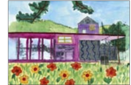
Das Schulhaus zur Dorfbeiz umwandeln (5./6. Klasse), Strassen und Brücken dominieren lassen (1./2. Klasse) oder der Turhalle ein Haus oder einen Kiosk auf's Dach setzen (Kindergarten Fuchsloch) – die Fantasie der jüngsten Oberwilerinnen und Oberwiler kennt keine Grenzen.