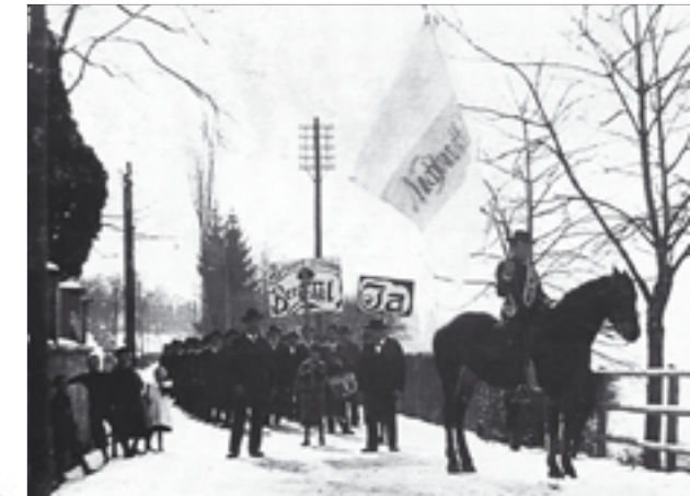
Hoch zu Ross, mit Fahnen und Trommeln: Die Oberwiler auf dem Marsch nach Zug zur Urne.

«Zweck des Nachbarschaftsverbandes ist es, die Oberwiler zu sam-