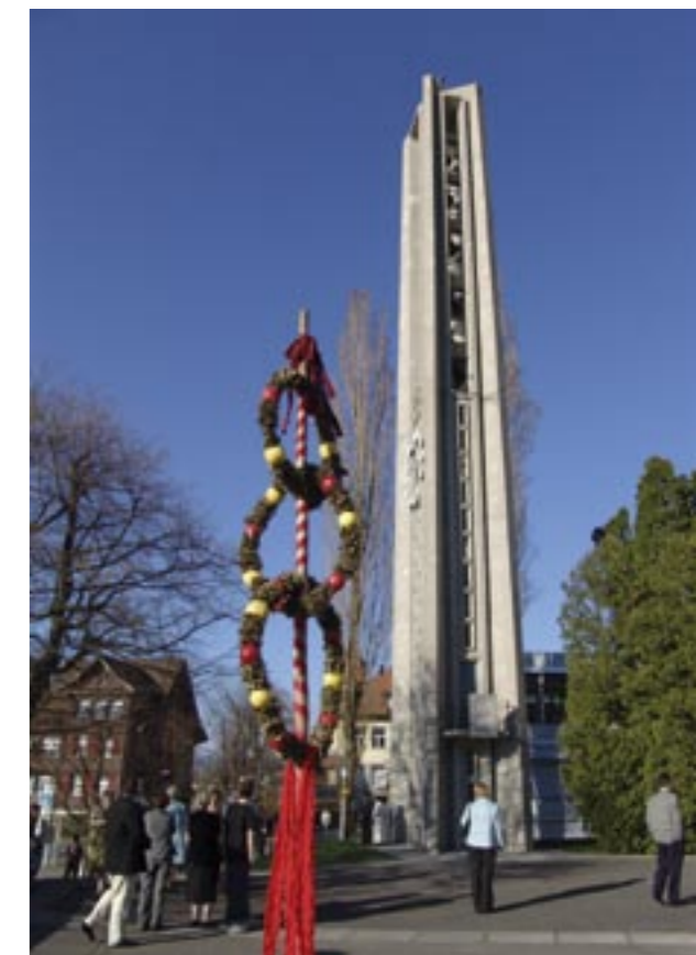
Eindrücke aus dem Oberwiler Kirchenleben.